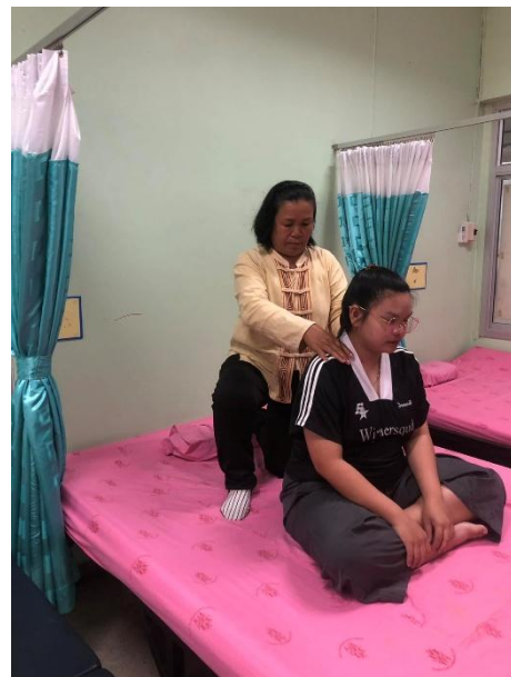
การนวดบริเวณไหล่