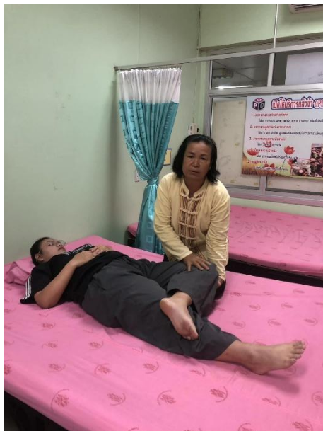
การนวดบริเวณหัวเข่าและขา

ผ่านการอบรมหลักสูตรผู้ช่วยแพทย์แผนไทย จากสถาบันการแพทย์แผนไทย กรมพัฒนาการแพทย์แผนไทยและการแพทย์ทางเลือก กระทรวงสาธารณสุข