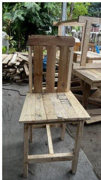
โต๊ะ - เก้าอี้ทำจากไม้พาเลท