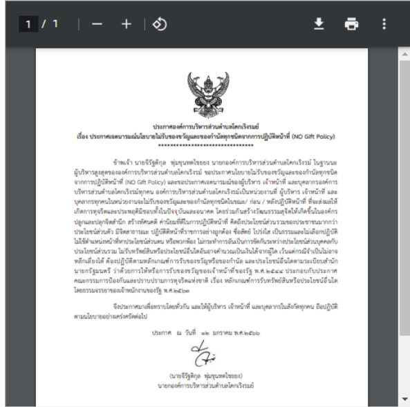
ประกาศคณะกรรมการส่วนตำบลโคกเจริญ ไม่รับของขวัญและของกำนัลทุกชนิดจากการปฏิบัติหน้าที่ (NO Gift Policy) พ.ศ.2566

ไฟล์เอกสาร : 12 ม.ค. 2566 ผู้ลงข่าว : อบต. โคกเจริญ